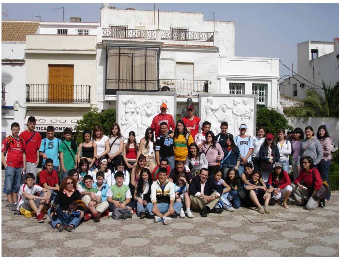
Moguer. Monumento a Juan Ramón Jiménez

Por otro lado, los textos creados por los alumnos pueden mostrar si éstos se han sentido movidos por la evocación del poema de Juan Ramón para la expresión de las propias emociones.