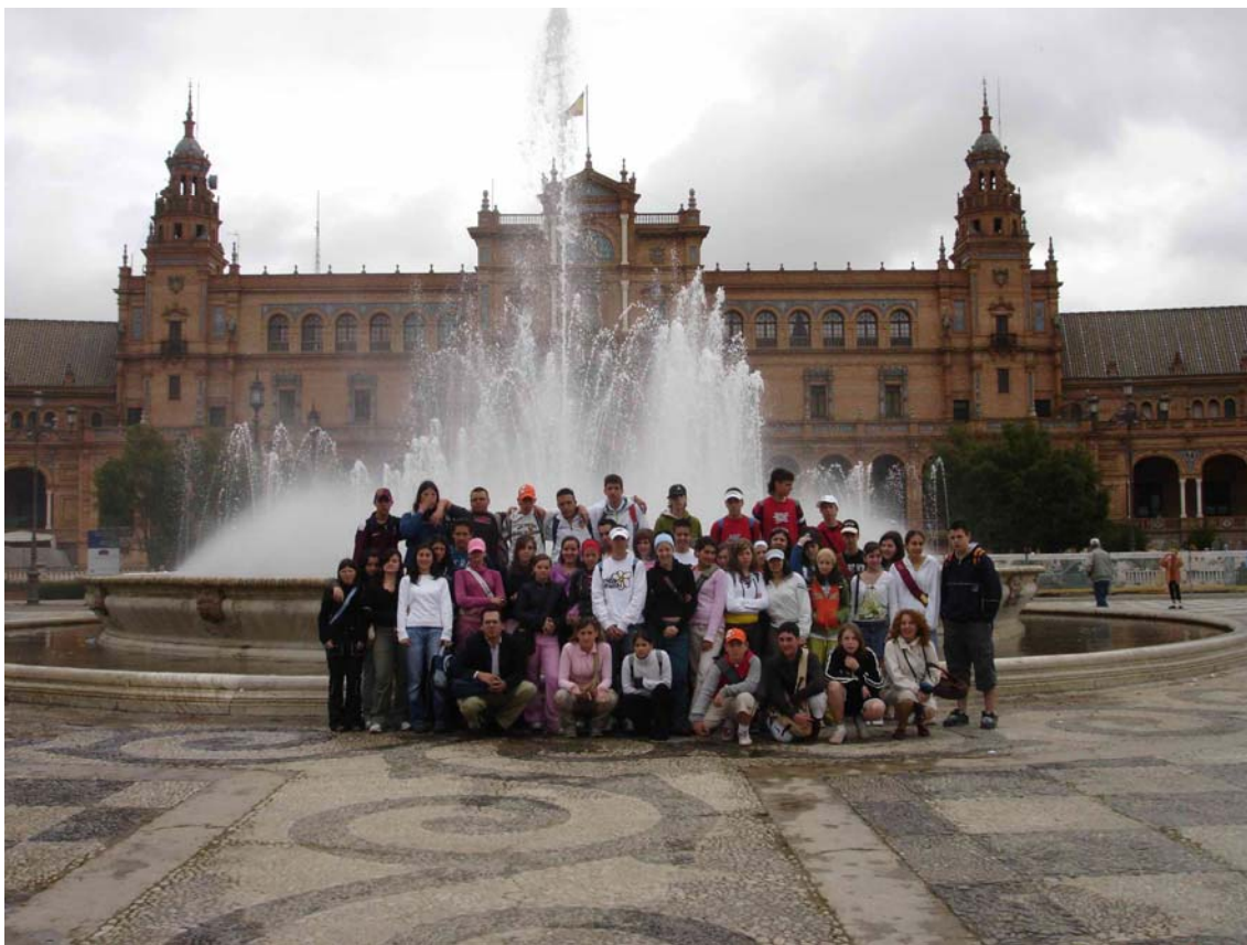
Sevilla. Plaza de España

7) Conocer los principales períodos, géneros, autores y obras de la literatura en Castellano y sus relaciones con la literatura europea de los siglos XIX y XX (obj. ár. núms. 7, 8, 9 y 10).