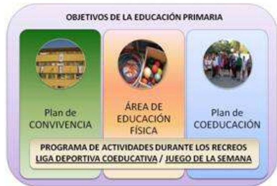
Figura 1. Relación del programa de actividades con los planes educativos.

Proponemos crear las condiciones para que, durante ese tiempo de recreo, se pueda compaginar la libre opción por el descanso, el juego o el desayuno, y todo ello bajo una organización cuyas normas de convivencia o participación favorezcan la socialización, coeducación, recreación y desarrollo de hábitos higiénicos y deportivos.