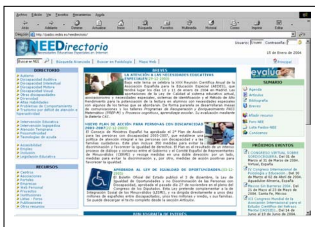
FOTO 2. NEEDirectorio

El portal Educativo de la región de Murcia ( http://www.educarm.es/ ) presenta junto con el Centro de Profesores y Recursos de Cieza ( http://www.cprcieza.net/ ) la web http://paidos.rediris.es/needirectorio/