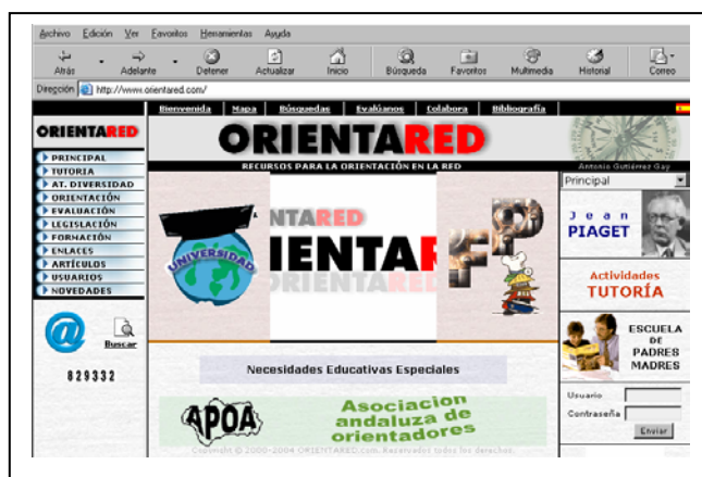
FOTO 3. Orientared

La Asociación Andaluza de Orientadores promueve el Centro de Recursos para la Orientación en la Red ( http://www.orientared.com/ ). La calidad de los contenidos es excelente aunque el formato web no presenta tanta actualización como el de paidos.rediris.es . Destacan la posibilidad de recursos tales como foros, enlaces 3 y bibliografía. En esta última sección incluso nos permiten que publicitemos nuestros trabajos sobre este tema.